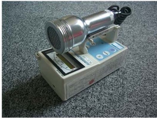
図 2—2 GM汚染サーベイメータ