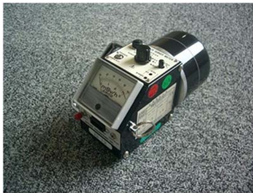
図 2—3 電離箱サーベイメータ