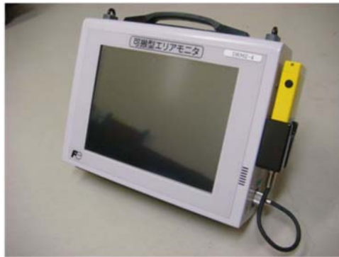
図 2—1 可搬型エリアモニタ