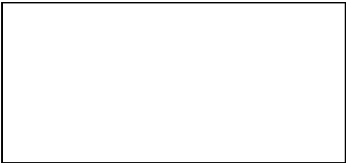
図 2-1 海水ポンプ室ケーブル点検口浸水防止蓋の設置位置図