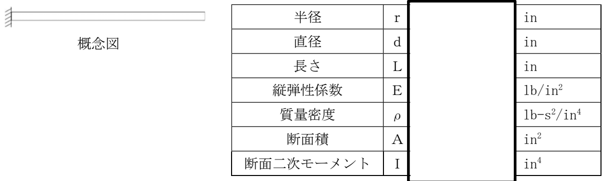
図3-2 概念図及び解析条件