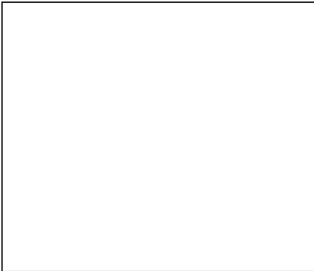
図 3-1 評価対象部位

緊急用海水ポンプ点検用開口部浸水防止蓋の耐震評価における評価対象部位を、図 3-1 に示す。