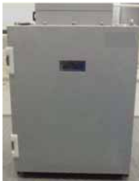
図 2-5 可搬型モニタリング・ポスト