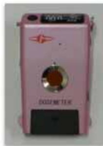
図 2-1 個人線量計