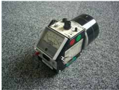
図 2-3 電離箱サーベイメータ