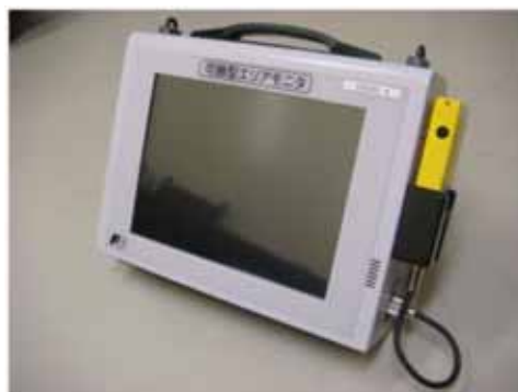
図 2-4 緊急時対策所エリアモニタ