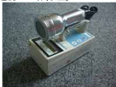
図 2-2 GM汚染サーベイメータ