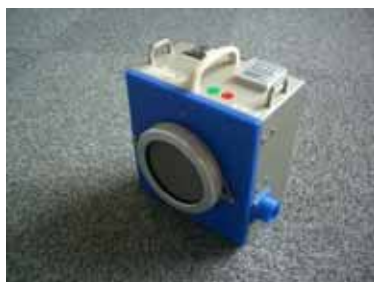
図 2-6 ダストサンプラ